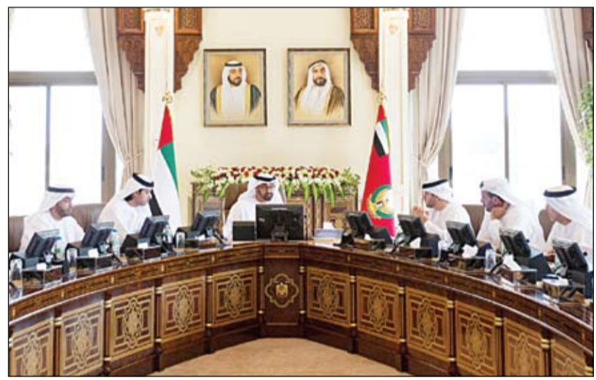
محمد بن زايد خلال ترؤسه اجتماع المجلس التنفيذي

تنفيذا لتوجيهات رئيس الدولة بضمن أفضل المستويات المعيشية للمواطنين محمد بن زايد يعتمد عددا من مشاريع البنية التحتية في أبوظبي بكلفة 1.5 مليار درهم •• أبوظبي-وام: ترأس الفريق أول سمو الشيخ محمد بن زايد آل نهيان ولي عهد أبوظبي نائب القائد الأعلى للقوات المسلحة رئيس المجلس التنفيذي لإمارة أبوظبي أمس الأربعاء اجتماع المجلس التنفيذي الذي عقد في ديوان سمو ولي العهد. واستعرض المجلس في مستهل اجتماعه الموضوعات الواردة من مختلف الدوائر والجهات التابعة لحكومة أبوظبي ووجه بضرورة أن تتكامل كافة الخطط والبرامج سواء تلك التي جرى العمل عليها أو تلك التي ما زالت في طور الإعداد سيما إلى تحقيق الهدف الأسمى للجهود المبذولة من مختلف الجهات بما يخدم أبناء الوطن على كافة الصعد المعيشية والاجتماعية والثقافية... التفاصيل (ص٢)