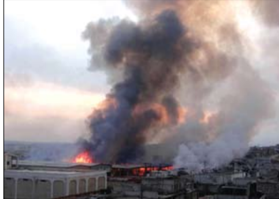
اعمدت الدخان تتصاعد جراء القصف الهجومي للنظام على ضواحي حلب