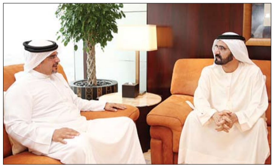
محمد بن راشد خلال استقباله ولي عهد مملكة البحرين

•• العين-وام: استقبل صاحب السمو الشيخ خليفة بن زايد آل نهيان رئيس الدولة حفظه الله .. بحضور الفريق أول سمو الشيخ محمد بن زايد آل نهيان ولي عهد أبوظبي نائب القائد الأعلى للقوات المسلحة ظهر أمس .. صاحب السمو الملكي الأمير سلمان بن حمد آل خليفة ولي العهد نائب القائد الأعلى النائب الأول لرئيس مجلس الوزراء في مملكة البحرين الشقيقة الذي يزور البلاد حالياً .. وذلك في قصر الروضة في مدينة العين. ونقل صاحب السمو الملكي الأمير سلمان بن حمد إلى صاحب السمو رئيس الدولة تحيات أخيه صاحب الجلالة الملك حمد بن عيسى آل خليفة ملك مملكة البحرين وصاحب السمو الملكي الأمير خليفة بن سلمان آل خليفة رئيس وزراء البحرين. وجرى خلال اللقاء استعراض العلاقات الأخوية المتميزة بين البلدين الشقيقين والتنسيق والتعاون المشترك بينهما في المجالات كافة بما يعود بالخير على شعبيهما الشقيقين وذلك في إطار مسيرة مجلس التعاون لدول الخليج العربية.. إضافة إلى تبادل وجهات النظر بشأن الأحداث والتطورات الراهنة على الساحتين الإقليمية والدولية والقضايا ذات الاهتمام المشترك. وأكد صاحب السمو رئيس الدولة خلال اللقاء حرص دولة الإمارات على تنمية وتعزيز استقرار مملكة البحرين الشقيقة. التفاصيل (ص٢)