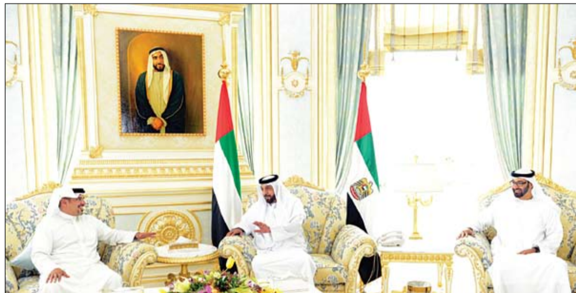
رئيس الدولة خلال استقباله سلمان بن حمد آل خليفة بحضور محمد بن زايد (وام)